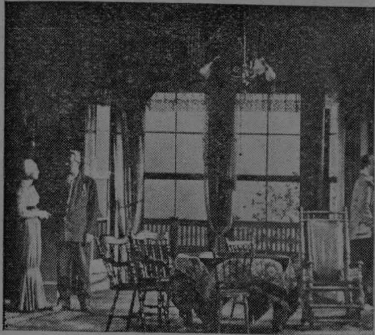
Una escena de la famosa y autobiográfica obra de Eugene O'Neill, "La Larga Jornada Hacia la Noche"

La obra teatral que en Nueva York, en Londres y en algunas otras ciudades europeas atrae mayor número de espectadores en la presente temporada, es la titulada "La Larga Jornada Hacia la Noche", de Eugene O'Neill, Premio Nóbel de Literatura, Doctor Honoris Causa de la Universidad de Yale y ganador de tres Premios Pulitzer, todo ello obtenido sin haberse el autor previamente graduado en universidad alguna.