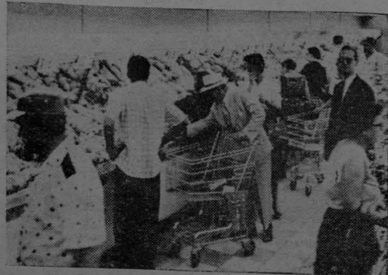
Uno de los modernos supermercados que han sido instalados en la ciudad de San Juan, Puerto Rico

Otros establecimientos, siguiendo el ejemplo de los supermercados, están estableciendo sistemas de autoservicio, todo ello con el fin de ofrecer más facilidades a los compradores y permitirles comprar a precios menores que los mantenidos con los antiguos sistemas de ventas.